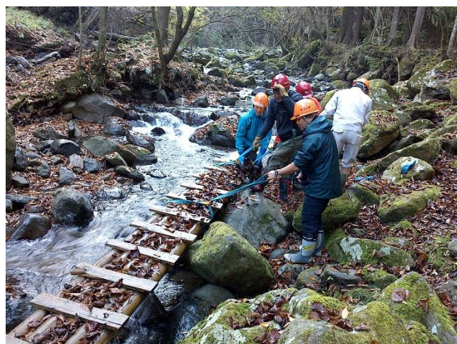
1. 川からの引き上げ作業