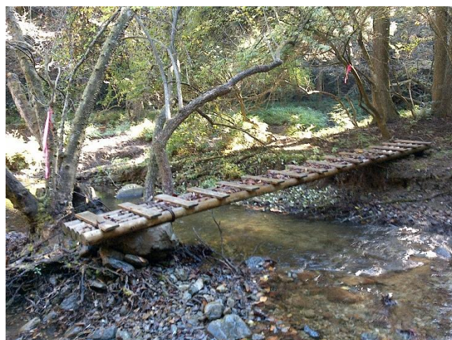
5. 木橋の架け直し完了 石を下に敷いて安定する様にしています

●木橋は滑りやすくなっている可能性がありますので、通行の際は十分にお気を付けください。