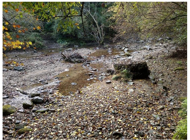
左：2021 年 右：作業前の写真