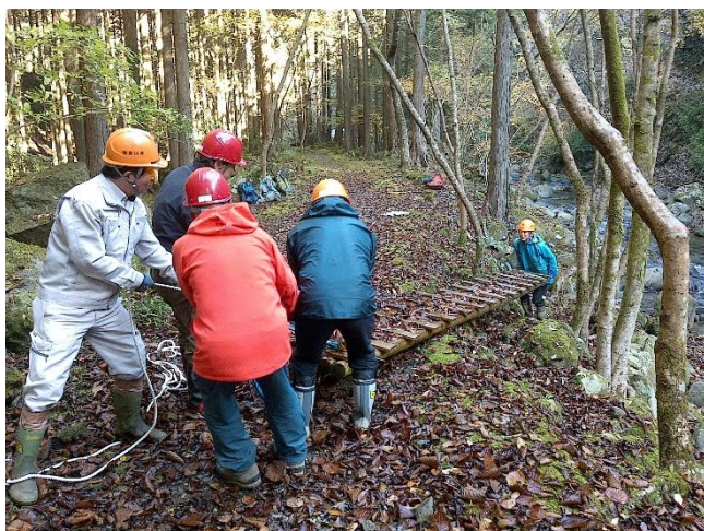
2. 登山道に上げる作業