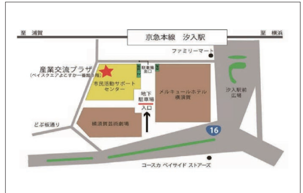
■横須賀市産業交流プラザ 京浜急行 汐入駅 徒歩1分