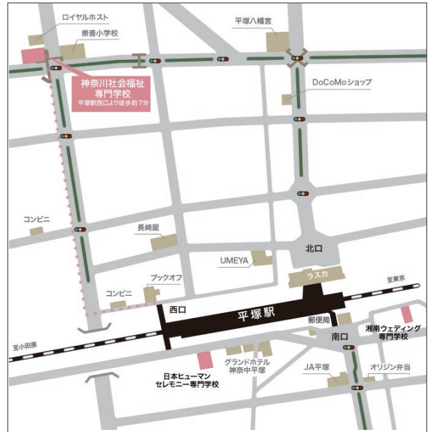
■神奈川社会福祉専門学校 JR東日本 平塚駅 徒歩7分