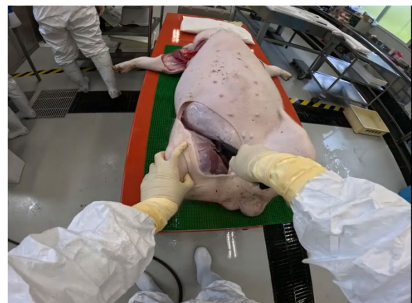
写真7 術者目線で作成した映像資料

作成した映像資料は解剖している職員の見線で撮影され、作業中の手元が常に写っていた（写真7）。術者が解剖手順を説明しながら作業が進行していく内容になっているため、解剖経験の少ない職員でも手順が理解しやすく、作成した映像資料を各職員が好きな時間に自主的に学習することが可能になり、技術継承の一助とすることができた。