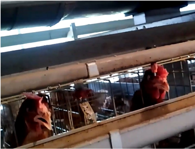
写真5 鶏舎内で開口呼吸をしている鶏