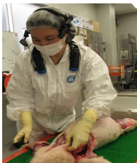
写真2 スマートグラス装着時

撮影中の音声・映像は同時に別の事務所にある複数の端末と共有可能で、剖検時の検体の外貌所見や見つかった病変を両家保に共有し互いに通話することによりリアルタイムで対応について検討することができ、有事の際には県畜産課と接続し速やかな情報共有が可能になった（図2）。