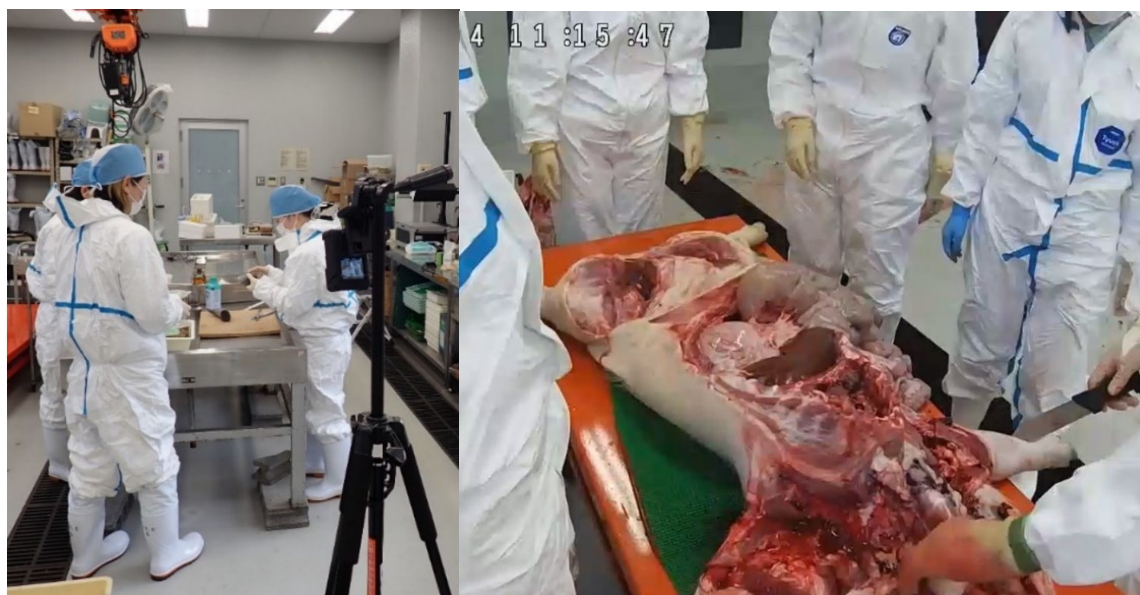
写真3 定点撮影の様子

しかし、スマートグラス同様通信環境によって通信が不安定になることがデメリットとしてあげられる。