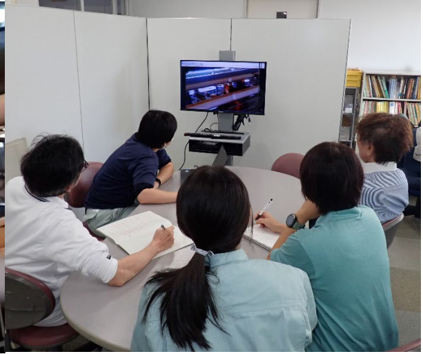
写真6 事務所とリアルタイムでの情報共有

従来、同様の検診対応を行う場合、農場からの通報を受け現場に向かった職員が聞き取り現場の記録などの現場対応を行い、状況を事務所に報告、帰所後に現場で撮影した画像などを共有し詳細報告・書類の作成を行っていた。一方ウェアラブル映像端末を用いた場合、現場の対応、事務所への連絡、画像共有をリアルタイムで同時に行うことで現場と事務所の連携を密にしながら全体の作業時間が短縮され迅速で正確な診断や防疫対応が可能となった。