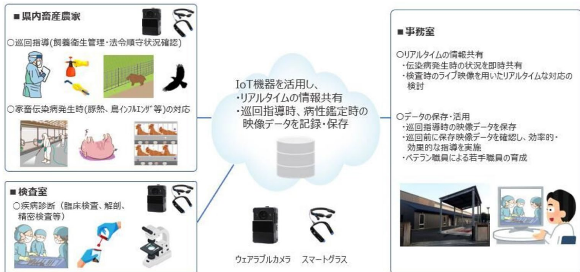
図1 家保におけるウェアラブル映像端末活用イメージ

実証実験を経て、県内家保ではスマートグラスとウェアラブルカメラ(写真1)、2種類のウェアラブル映像端末を導入し、令和7年度より業務での活用を開始した。