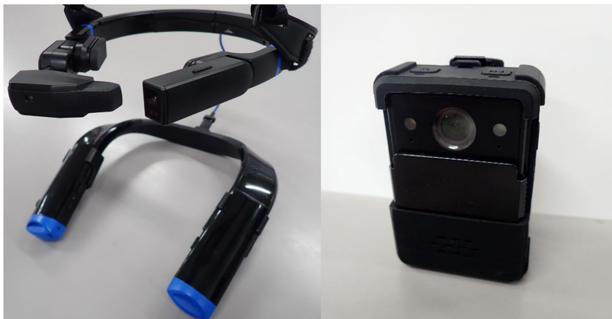
写真1 スマートグラス(左)とウェアラブルカメラ(右)

実証実験を経て、県内家保ではスマートグラスとウェアラブルカメラ(写真1)、2種類のウェアラブル映像端末を導入し、令和7年度より業務での活用を開始した。