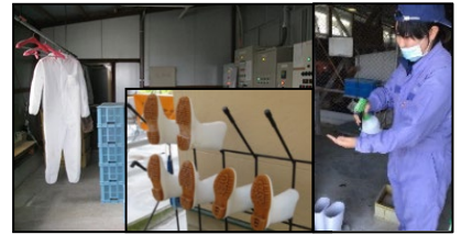
専用の服や靴の使用、手指消毒