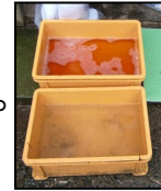
推奨される踏込消毒槽の設置方法！