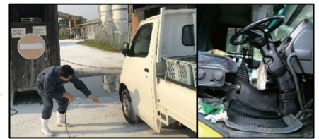
車両はタイヤだけでなく、 泥よけの内側まで消毒 し、 フロアマットの交換 や ペダル等車内も消毒