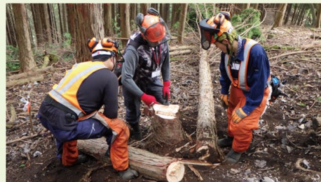
かながわ森林塾演習林実習コース 間伐実習(県立21世紀の森)