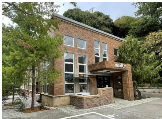
旧神奈川県営湘南水道鎌倉加圧ポンプ所