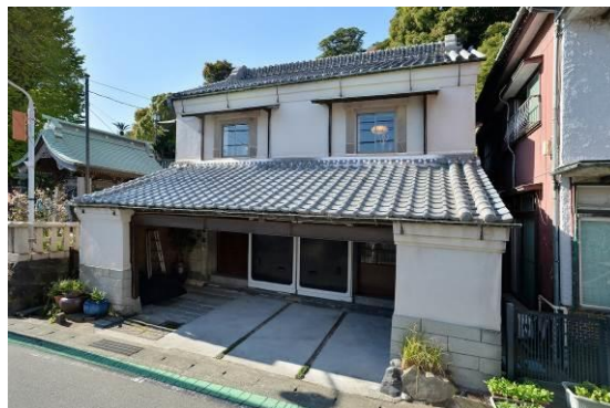
穴澤家住宅座敷蔵