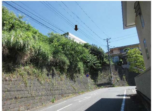
追加指定地の現状 矢印下（総構二重外張 そうがまえふたえとぼり ）