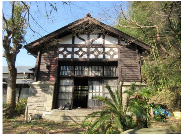
旧石田家国府津別邸洋館