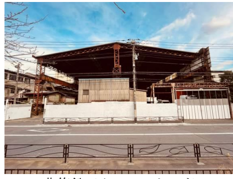
北條鉄工クレーンヤード