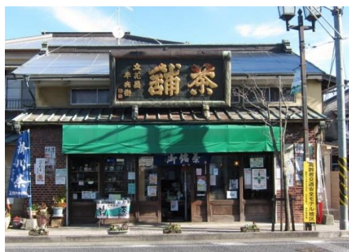
立花屋茶舗店舗兼主屋