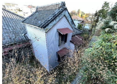
旧川本家住宅内蔵