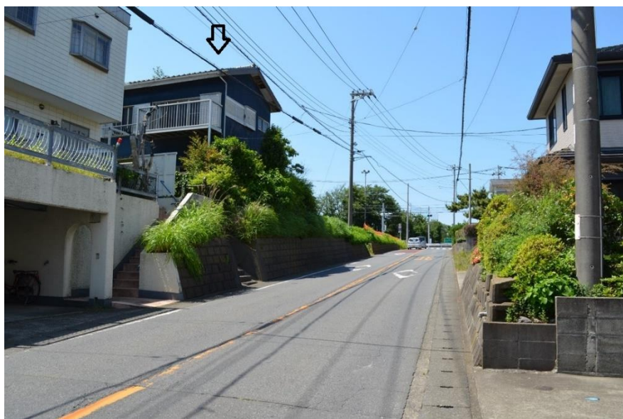
追加指定地の現況 矢印下