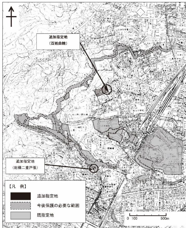
追加指定地の位置図

概要 戦国時代、小田原北条氏が関東支配の中心拠点として整備・拡張した城跡。小田原北条氏滅亡後、大久保氏他の譜代大名が城主となり、関東地方の入口の防御の要として江戸時代を通じて重視された。今回、総構の中に位置し、「百姓曲輪」と「総構二重外張」の既指定地に隣接する条件の整った部分を追加指定する。