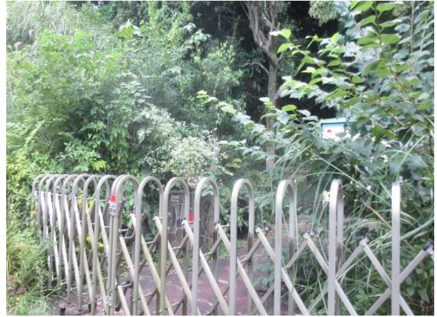
追加指定地の現況（百姓曲輪 くわ ）