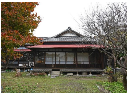
旧平野家住宅主屋