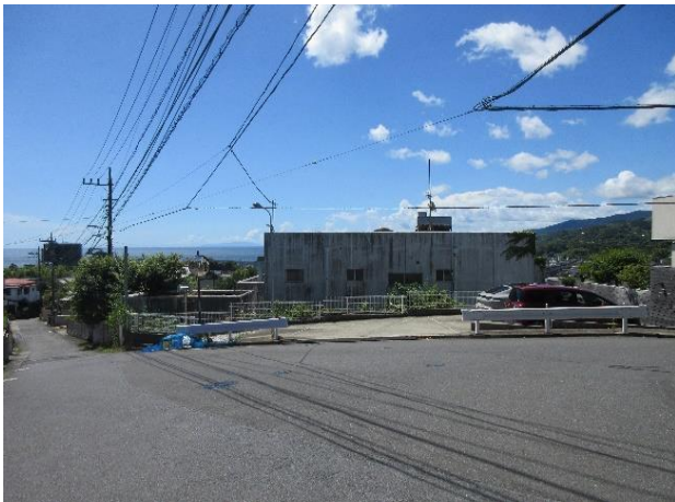
追加指定地の現状（総構二重外張 そうがまえふたえとぼり ）