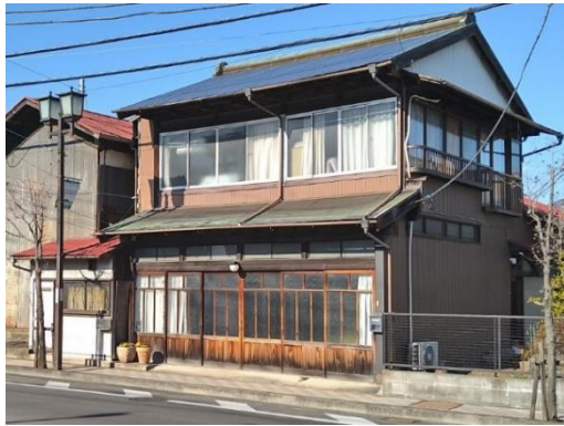
旧澤良商店店舗兼主屋