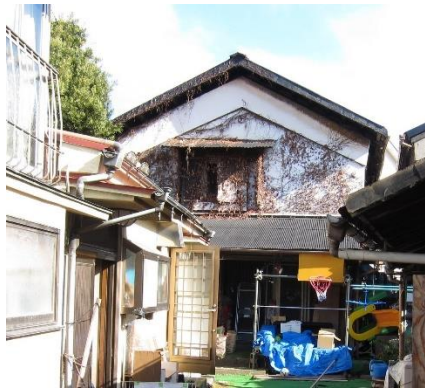
立花屋茶舗左の蔵