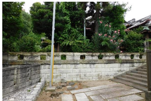
旧川本家住宅表門及び石垣