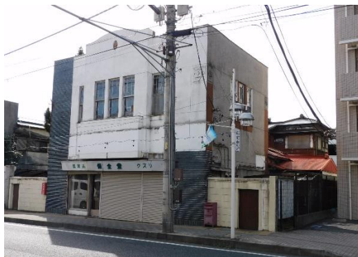
保全堂薬局店舗兼主屋