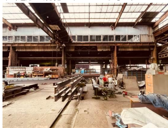
北條鉄工原寸工場