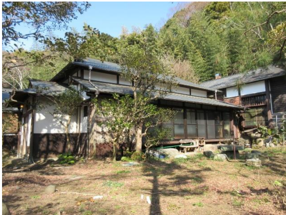
旧石田家国府津別邸主屋