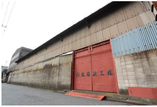
北條鉄工旧シャーリング・製缶及びロール工場