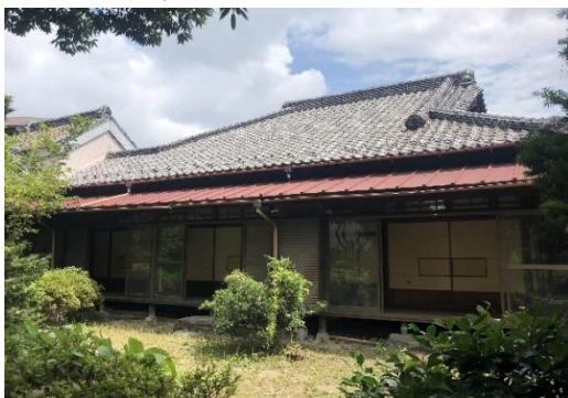
旧川本家住宅主屋

内蔵、表門及び石垣：登録有形文化財登録基準1号該当（国土の歴史的景観に寄与しているもの）