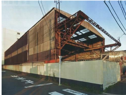
北條鉄工材料置場