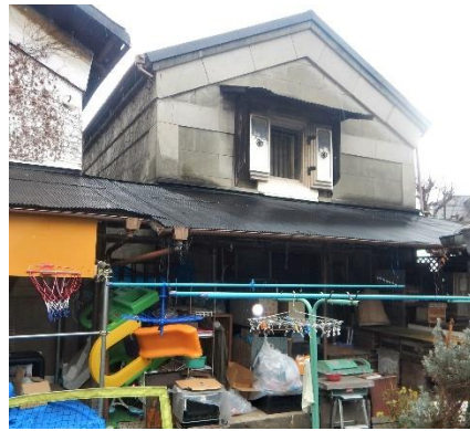
立花屋茶舗右の蔵