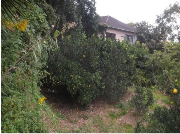
追加指定地の現況（百姓曲輪 くわ ）