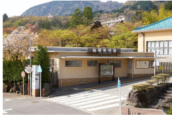
箱根美術館休憩所