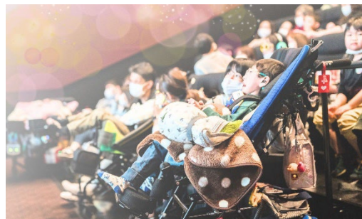
障がい児、医療的ケア児が楽しめる スポーツ・芸術・文化の体験 (特定非営利活動法人 AYA)