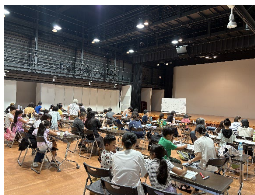
県内2か所における日本語学習支援 (NPO法人 多文化共生ボランティア団体KAM)