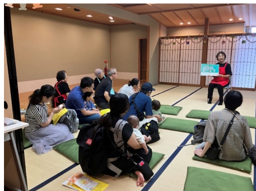
川崎市多摩区内の小・中学校、保育園、子育て支援センター、 高齢者施設などで絵本の読み聞かせを実施 (シニア読み聞かせボランティアアブリんと・かわさき)