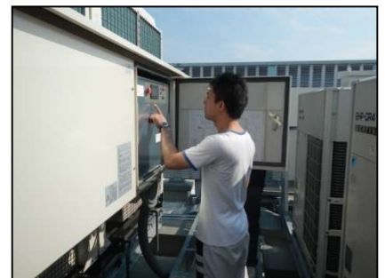
冷凍機・空調保守