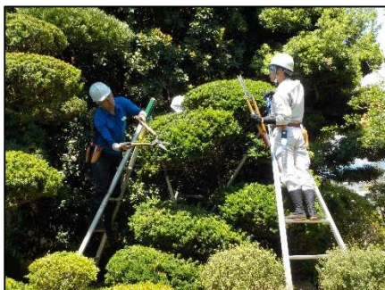
樹木の整枝・剪定実習