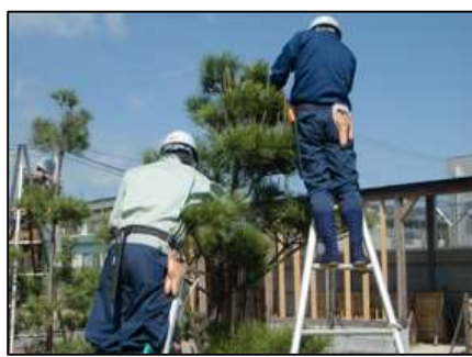
樹木の整枝・剪定実習