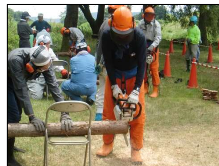
チェーンソー運転実習