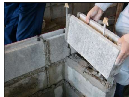
ブロック施工実習