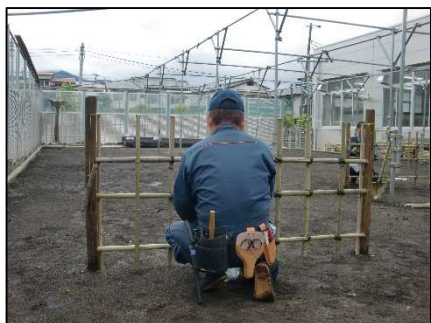
垣根施工実習（四ツ目垣）