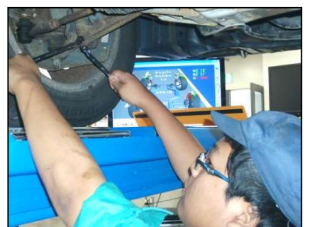
アライメント実習（応用）