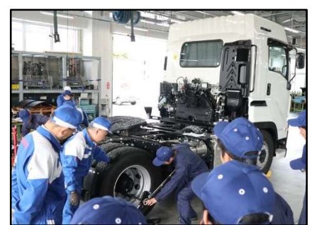
大型車両整備実習