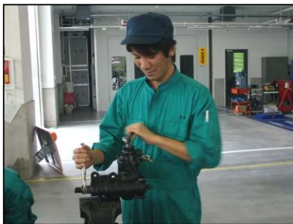
ステアリング装置実習