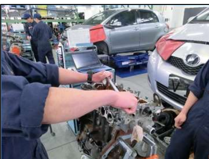
エンジン整備実習