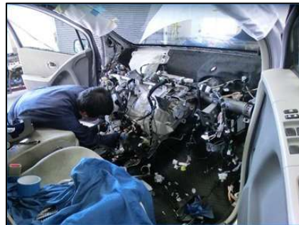
空調装置整備実習