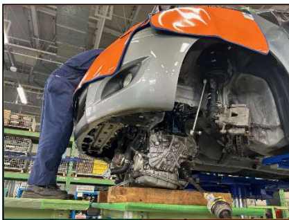
エンジン脱着実習