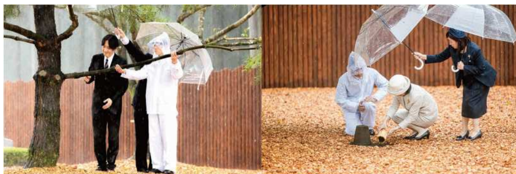
お手入れ行事 (令和6年 福井県)