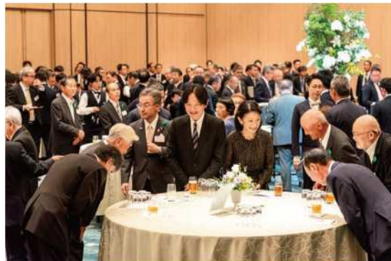
懇談会 (令和6年 福井県)