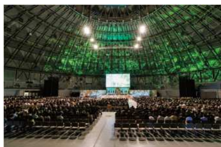
式典行事 (令和6年 福井県)