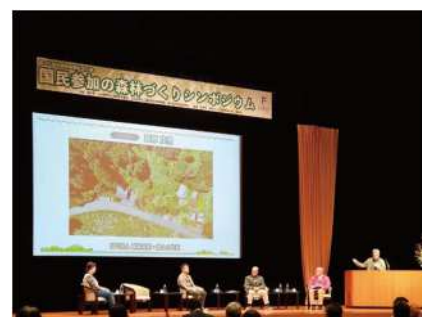
国民参加の森林づくりシンポジウム (令和6年 福井県)