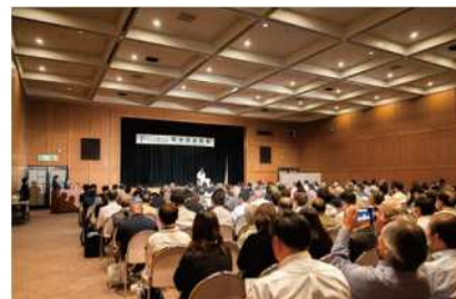
育林交流集会 (令和6年 福井県)