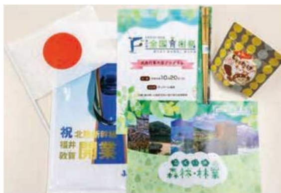
式典行事参加者記念品及び大会パンフレット等 (令和6年 福井県)

廃棄物を抑制する観点からリユースやリサイクルが可能な素材等の利用や、県産木材を積極的に活用します。