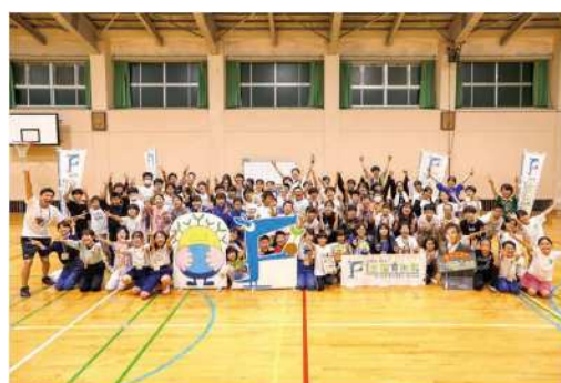
交流集会 (令和6年 福井県)