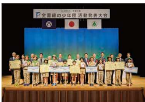
活動発表大会 (令和6年 福井県)