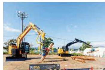
森林・林業・環境機械展示実演会 (令和6年 福井県)