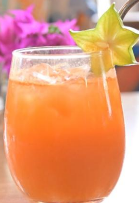
フルーツと人参のジュース