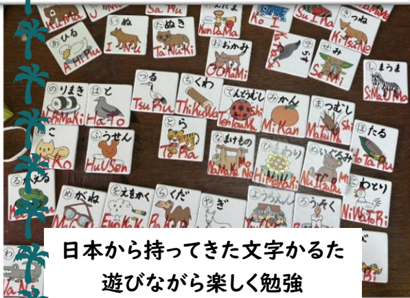
日本から持ってきた文字かるた 遊びながら楽しく勉強

日本のアニメが好きで日本語に興味のある生徒が多く、試験が終わってから学校全体が2週間自習ばかりだったので、日本語の授業&日本紹介の授業を毎日4クラスしました。サモアから日本・中国・韓国の大学への奨学金もあります。まずは中国語と日本語の違いを教え、それから平仮名、数字、自己紹介の練習。『アキノセンセイ!』と呼んでくれるようになりました泣