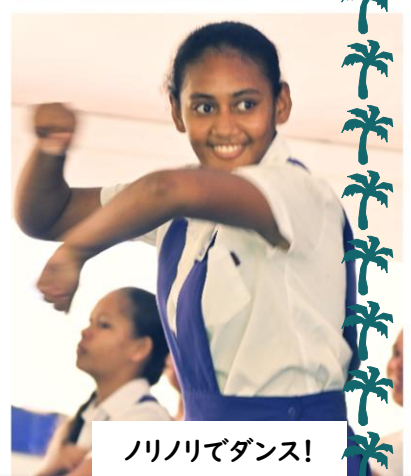
ノリノリでダンス!