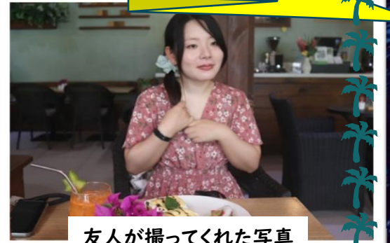
友人が撮ってくれた写真