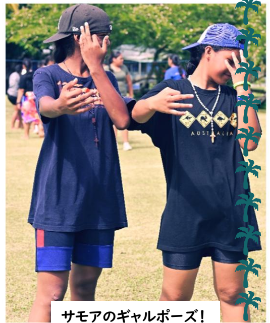
サモアのギャルポーズ！