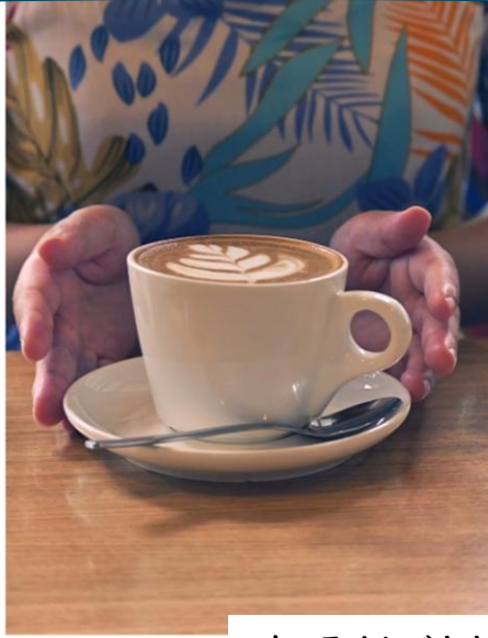
キャラメルバナナ クレープ→