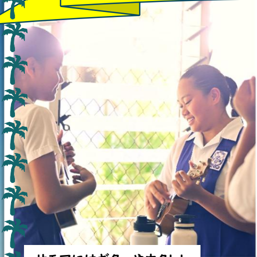
サモアにはギターやウクレレを弾ける子が多いです