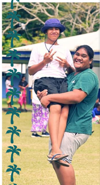
ポリネシア系民族は 力持ちが多いみたいです