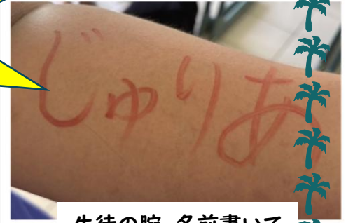
生徒の腕。名前書いて と言われた…笑