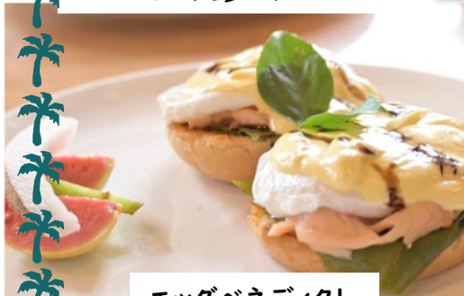
エッグベネディクト

サモアは途上国ということで、たまに断水や停電が起きたり、G など虫が沢山いて不衛生だったり、日本の暮らしと比べて不便なこともあります。しかし、 サモアに来て7か月目にして、とってもお洒落なカフェを見つけました!! たまに息抜きに行きたいと思います。