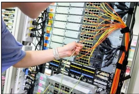
ネットワーク基盤の構築