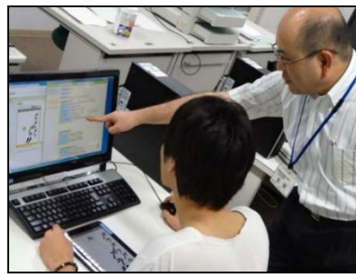
モバイル端末アプリケーションの作成