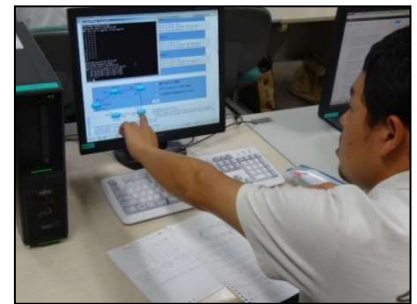
Webアプリケーションの開発