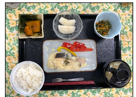
大量調理実習（常食、定食形式）