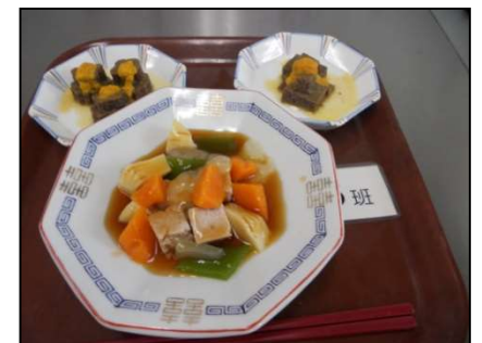
嚥下困難者向けの食事 （ソフト食の酢豚）