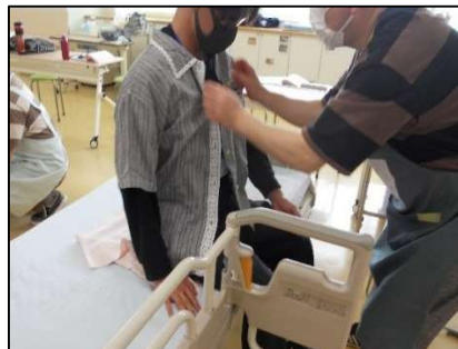
初任者研修実習： 生活支援技術実技（整容）