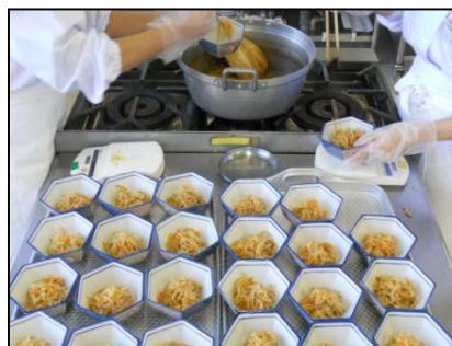
大量調理実習（盛付）