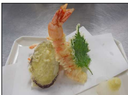
基礎調理 （和え物、揚げ物、焼物など）