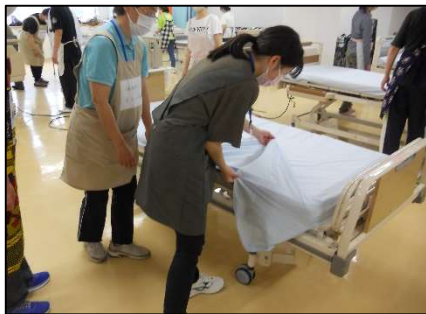
初任者研修実習： 介護技術の基本（ベッドメイキング）