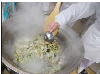
大量調理実習（大量調理機器）