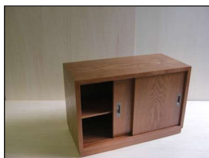
課題例 1(DVD ラック)