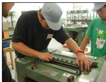
木工機械のメンテナンス