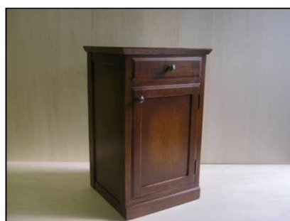
課題例 2(ベッドサイドボード)