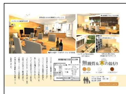
室内計画 (プレゼンテーション)