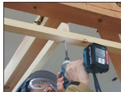
建築施工総合実習