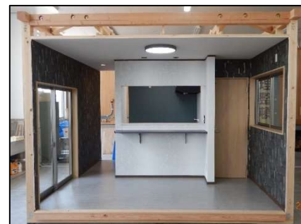
建築施工総合実習