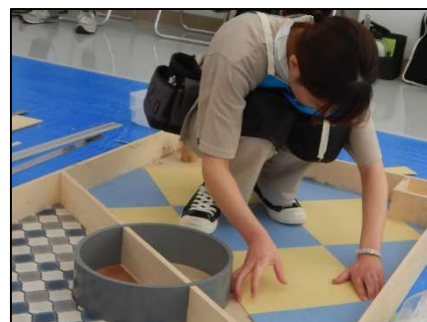
内装施工 (床仕上げ)