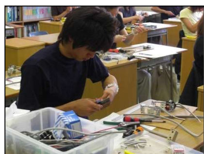
電気工事士試験対策