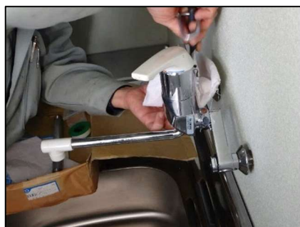
給排水設備工事 (器具取付け)