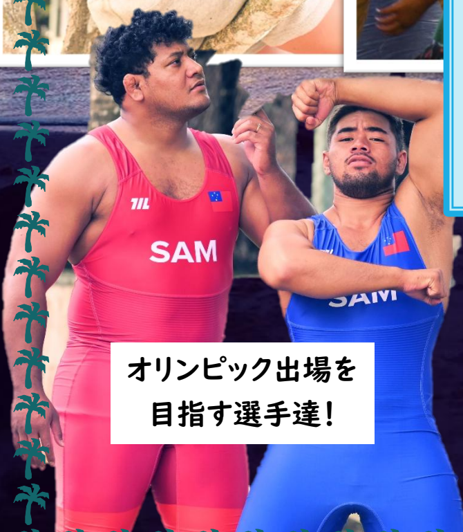
オリンピック出場を 目指す選手達！

オリンピックを目指して練習して、生徒 達がこれから強くなるという時に、経済 的な事情から夢を諦め、 オーストラリア やニュージーランドへ出稼ぎ に行って しまうこともあるそうです。