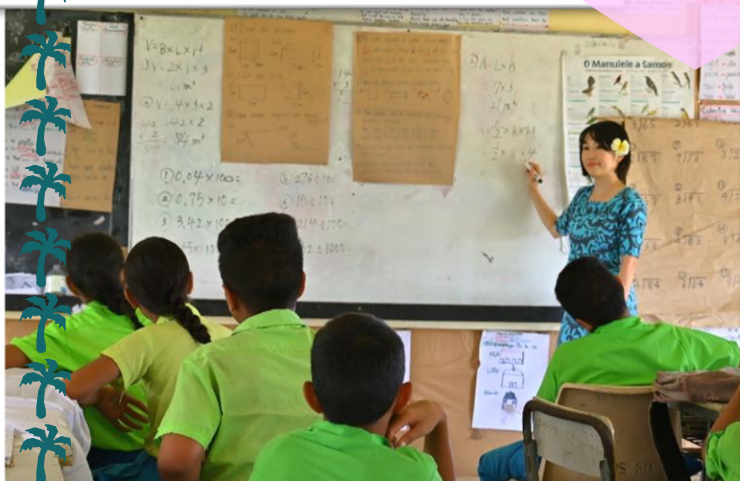
先輩隊員は、理科や算数の授業担当