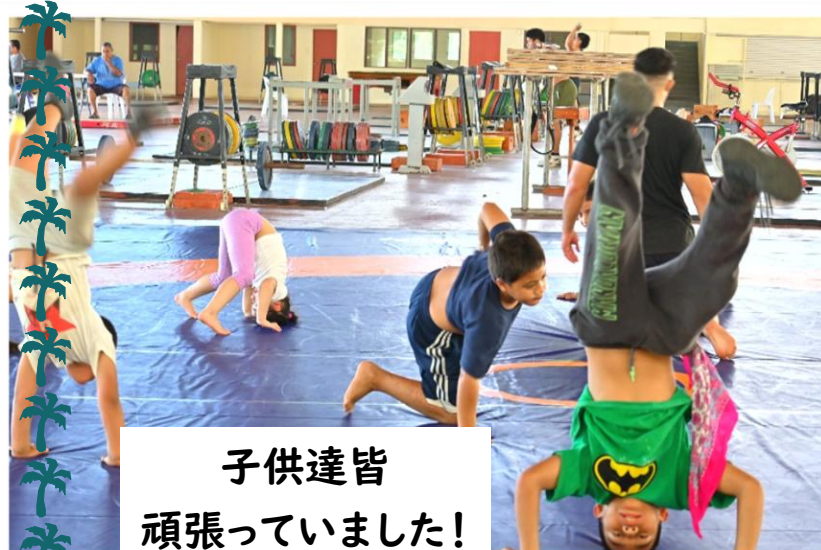
子供達皆 頑張っていました！