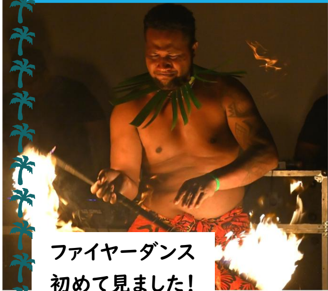
ファイヤーダンス 初めて見ました!

私は普段、サモアのウポル島の北側に住んでいます。先輩隊員の方達と、南側にあるビーチファレに泊まって来ました!ビーチファレに泊まるのは2回目です(※第2号の記事参照)。この茅葺き屋根の小屋の中で、蚊帳を張り、波の音を聞きながら眠ります。シャワー施設など決して綺麗とは言えないけれど、サモアの自然をめいっぱい感じられる素敵な経験が出来ました。