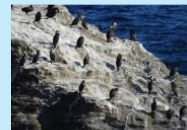
ウミウ Japanese Cormorant

Japanese Cormorants fly from the Kuril Islands every November, build a nest on the cliffs of the island and live there until April of the following year. The habitat of Japanese Cormorant is a natural monument designated by Kanagawa Prefecture.