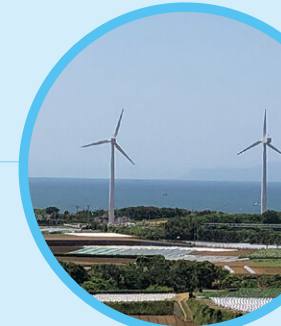
宮川公園の風車 Wind mills in Miyagawa