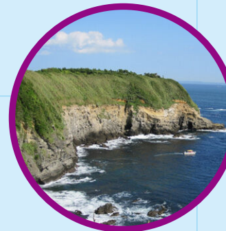
三浦半島八景 城ヶ島 Jogashima Island, one of the Eight Picturesque Views of Miura Peninsula