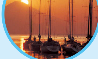
諸磯湾のヨット Yachting in Moroiso Bay