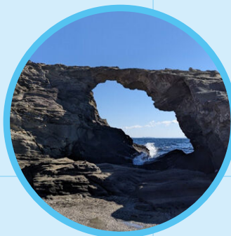
馬の背洞門 Umanose-Domon (Sea Cave)