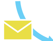
※実際の画面とは異なる場合があります

皆さまからの報告を起点に、厚生労働省、PMDA、製造販売業者など、医療にかかわる人たちが報告情報を活用することで、日本の医療を支えています。