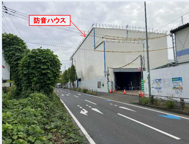
工事ヤード(防音ハウス)全景