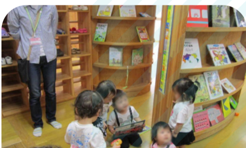
地域子育て支援拠点

子育て中の親子が仲間を作ったり、子育て 情報を得るための施設です。子どもの発達 や生活の困りごとについて気軽に相談でき ます。