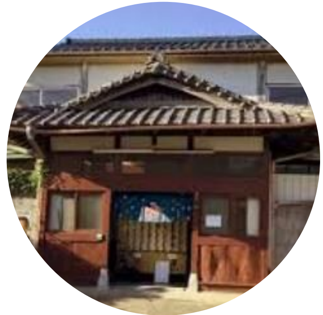
鎌倉市様 銭湯活性化事業 銭湯