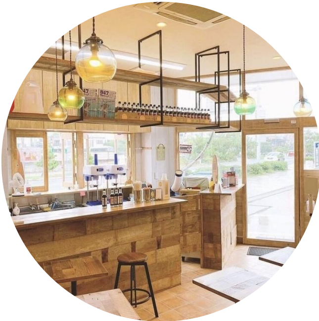
湘南菱油様 ビーガンクレープ店 ニコフル