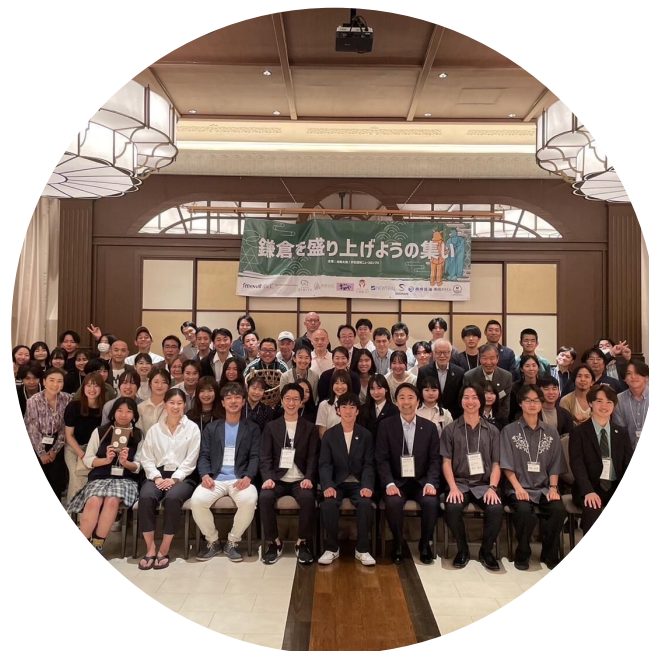
鎌倉を繋ぎ、ひろげる