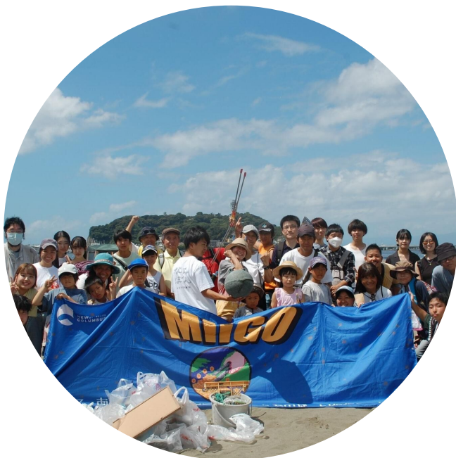
ビーチクリーンアドベンチャー